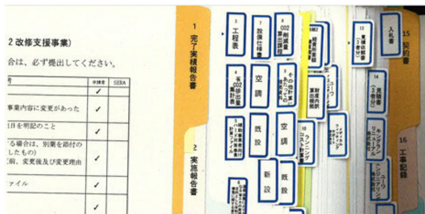
インデックスの例