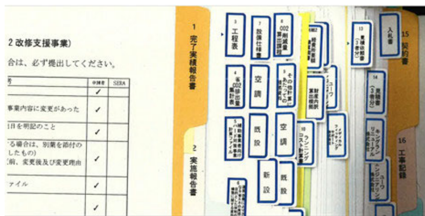
インデックスの例